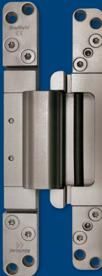
MASTERBAND® FX2 120 3-D FD